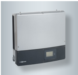
Växelriktare för solceller. Omvandlar likspänningen från solcellspanelerna till växelspanning.