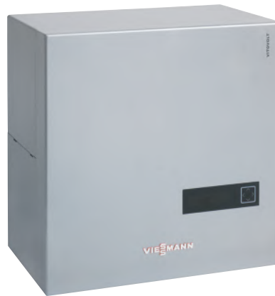
Växelriktare för solceller. Omvandlar likspänningen från solcellspanelerna till växelspänning