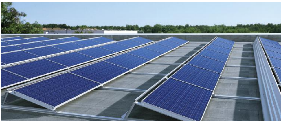
Solcellssystem monterat på ett plant tak