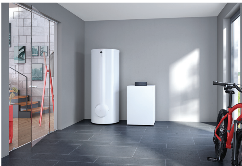
Bergvärmepumpen Vitocal 200-G tillsammans med varmvattenberedaren Vitocell 100-W

Den effektiva och tysta bergvärmepumpen Vitocal 200-G är lättplacerad tack vare sina kompakta mått.