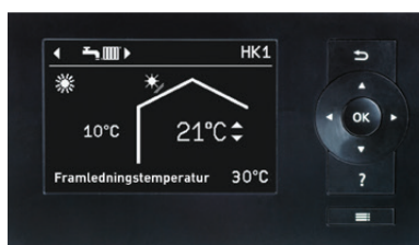
Reglerings display, Vitotronic 200 (Typ WO1C)

Med hjälp av kommunikationsmodulen Vitoconnect 100 kan du enkelt fjärrstyra och övervaka din värmeanläggning via vår ViCare App.