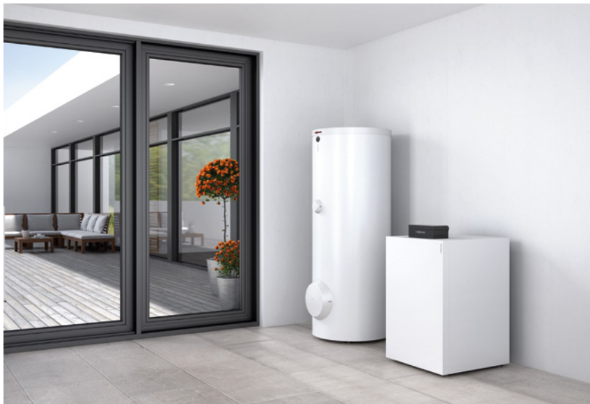
Bergvärmepumpen Vitocal 300-G tillsammans med varmvattenberedaren Vitocell 100-W

Tack vare modern inverterteknik är nya Vitocal 300-G en mycket effektiv lösning både vid nyinstallation och utbyte.