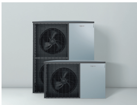
Nya uteenheter i tidlös Viessmannsdesign

Värmepumpen är dessutom förberedd för att samverka med solcellsanläggningar. Du kan t.ex. programmera värmepumpen så att den startar och laddar upp extra mycket och extra varmt varmvatten när solcellsanläggningen producerar tillräckligt mycket överskottsel. Helt enkelt köra värmepumpen med "gratisel".