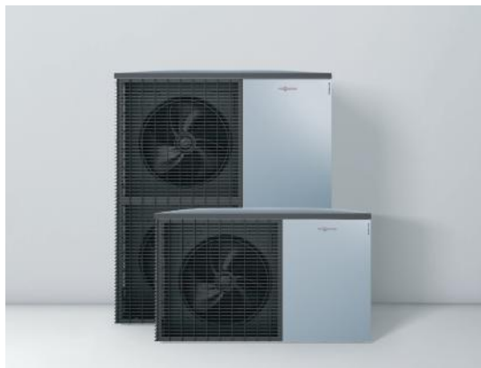
Uteenheter i tidlös Viessmann-design

Värmepumpen är dessutom förberedd för att samverka med solcellsanläggningar. Du kan t.ex. programmera värmepumpen så att den startar och laddar upp extra mycket och extra varmt varmvatten när solcellsanläggningen producerar tillräckligt mycket överskottsel. Helt enkelt köra värmepumpen med "gratisel".