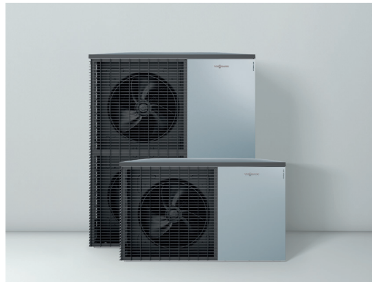
Nya uteenheterna i tidlös Viessmannsdesign

Värmepumpen är dessutom förberedd för att samverka med solcellsanläggningar. Du kan t.ex. programmera värmepumpen så att den startar och laddar upp extra mycket och extra varmt varmvatten när solcellsanläggningen producerar tillräckligt mycket överskottsel. Helt enkelt köra värmepumpen med "gratisel".