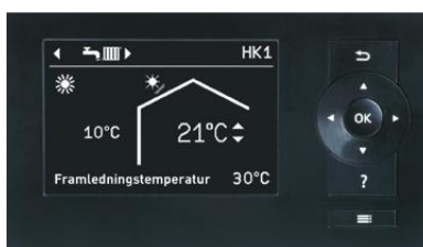
Reglerings display, Vitotronic 200 (Typ WO1C)

Med hjälp av kommunikationsmodulen Vitoconnect 100 kan du enkelt fjärrstyra och övervaka din värmeanläggning via vår ViCare App.