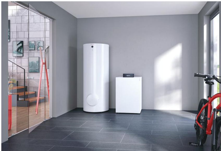
Bergvärmepumpen Vitocal 200-G tillsammans med varmvattenberedaren Vitocell 100-W

Den effektiva och tysta bergvärmepumpen Vitocal 200-G är lättplacerad tack vare sina kompakta mått.