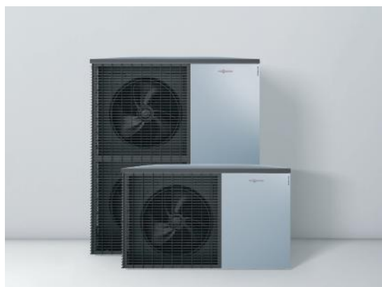
Nya uteenheterna i tidlös Viessmann-design