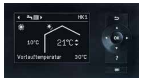
Display på reglerutrustningen Vitotronic 200