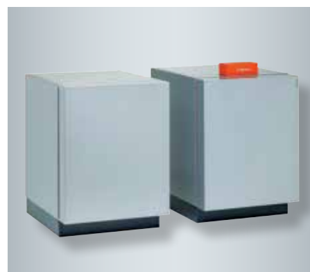
Tvåstegspump Vitocal 350-G (master höger/slave vänster) som brine/vatten- resp. vatten/vattenvärmepump

En intelligent styrning ökar den egna elförbrukningen från solcellsanläggningen. Reglerutrustningen Vitotronic 200 (typ WO1C) har olika regleringsstrategier för detta, t.ex. optimerad varmvattenuppvärmning.